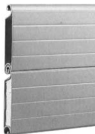
RULLEJALOUSI TIL PORTE (DOBBELTVÆGGET LAMEL)

Gitre og jalousier anvendes til sikring mod uønsket adgang til bygninger (skalsikring), hvor de monteres ved eksempelvis indgangspartier og døråbninger. De anvendes også til sikring af afdelinger eller afsnit inde i bygninger (cellesikring). Vore løsninger leveres i flere forskellige design og sikringsklasser – vi fremstiller også specialløsninger efter ønske.