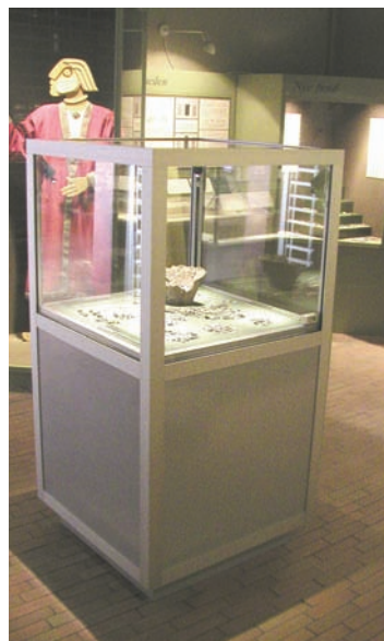
GLASS SAFE AIR

GLASS SAFE AIR til sikring af udstillinger og samlinger. Investeringen kan optimeres med forskellige glastyper i monterne. Hjørne- og dørprofiler er altid Skafor klassificeret i Rød klasse. Hjørneprofilernes bredde på kun 48 mm giver mulighed for større glasflader – og gør dermed sikringen unik.