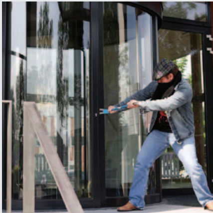
PASSAGESIKRING OG PERIMETERSIKRING