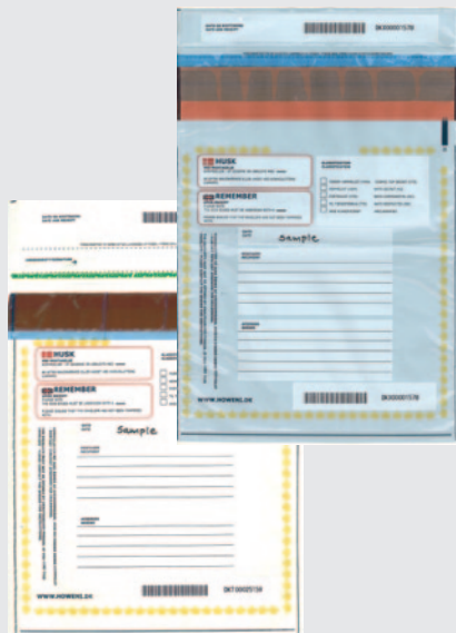
PLOMBER OG FORSEGLING

VI GLÆDER OS DERFOR MEGET TIL DET KOMMENDE ÅR OG TAKKER ENDNU EN GANG FOR DEN OPBAKNING VI FÅR FRA VORE KUNDER OG SAMARBEJDSPARTNERE.