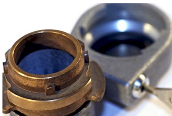
TANKSIKRING HS2 STANDARD STUDS SAMT DÆKSEL

HS TANKSIKRING afhjælper det stigende antal tyverier af olie og benzin fra private og den offentlige sektor. Systemet anvendes til sikring af rørsystemer og kan monteres på alle 2 tommer rør. HS Tanksikring leveres også til 3 og 4" rør - både under og overjordisk.