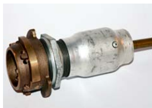
SIKRINGSSTUDS TIL UDLUFTNINGSRØR

Vi laver endvidere kørebanedæksler med skjult lås og helt plan overflade som anvendes til beskyttelse af "følsomme" kabel- og rørbrønde i trafikerede områder.