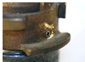
SIKRINGSSTUDS FASTGØRES MED UMBRACKO-NØGLE