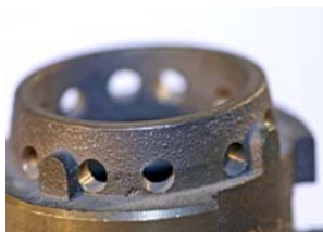
SIKRINGSSTUDS HS2 MED UDLUFTNING