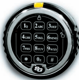
SARGENT AND GREENLEAF Z03D

SARGENT & GREENLEAF ELEKTRONISKE KODELÅSE er primært konstrueret til aflåsning af brand-, penge- og værdiskabe, boksdøre, pengeautomater og døgnbokse etc. De kan alle monteres ved såvel nyleverancer som eftermonteres på allerede eksisterende sikringsenheder.