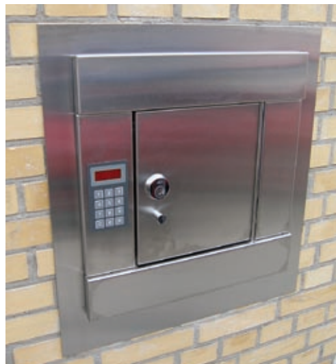
DØGNBOKS CENTERSAFE K MED KODETASTATUR

DØGNBOKS CENTERSAFE K ER MARKEDETS MEST STABILE DØGNBOKS I ET FLOT OG ENKELT DESIGN. LEVERES I TO PRAKTISKE STØRRELSER OG EN KLASSIFICERET I GRADE IV ELLER V.