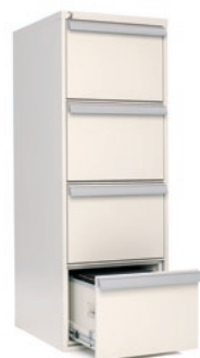
FIRESAFE VERTICAL 4