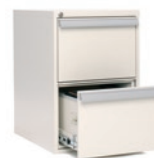
FIRESAFE VERTICAL 2

FIRESAFE VERTICAL FireSafe Vertical er en serie brandsikre skuffeskabe fremstillet i årtier i et tidsløst og funktionelt design. Ultratynde vægge øger skuffeskabenes indvendige kapacitet. FireSafe Vertical's kompakte design passer perfekt til de fleste kontormiljøer.