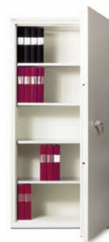
FIRESAFE BDA 460

FIRESAFE BDA er en serie brandsikre dokumentskabe - FireSafe BDA 330, 460, 580 samt 990. Skabene er brandsikre til papir og dokumenter i minimum 60 minutter. FireSafe BDA anvendes oftest til ringbind; men kan også indrettes til hængemapper, monteres med skrivehylder mv.