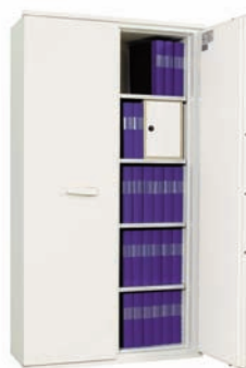
FIRESAFE BDA 580