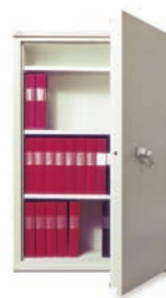
FIRESAFE BDA 330