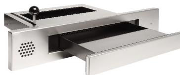
WF 53.01 FB4/M3

Vi har mange forskellige standardløsninger og fremstiller desuden specialløsninger tilpasset individuelle krav. Selvom vore produkter er udviklet med en unik erfaring, i et robust design og meget høj kvalitet som sikrer lang levetid, tilbyder vi også serviceaftaler for at sikre helt uproblematisk drift. Vore betjeningsluser er testet efter den europæiske standard EN 1522 fra FB2 til FB7 (bullet resistance protection). Enkelte er dog testet efter den gamle standard 52290 i klasse M3.