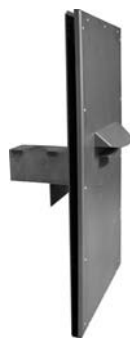
AUTOKEY DEPO G HALVFABRIKATA

Vi har flere forskellige løsninger der tilgodeser forskellige behov og sikrer at både kunder og medarbejdere opleve at både deponering og tømning af bilnøgler sker let og ukompliceret. Systemet er serviceforbedrende idet kunderne nu i større udstrækning er uafhængige af åbningstider.