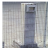
AUTOKEY DEPO FREESTANDING